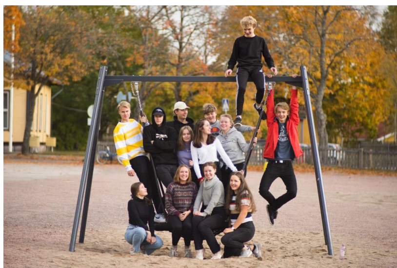
Opiskelijakunnan hallitus 2019-2020